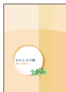
胃がん 手帳 地域連携パス