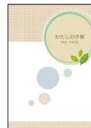
前立腺がん 手帳 地域連携パス