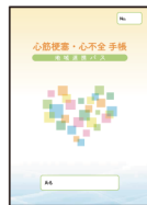
心筋梗塞・心不全 手帳 地域連携パス