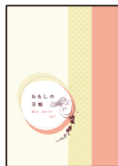
乳がん患者さんのための「わたしの手帳 Ver.7」

【事務局】広島県医師会地域医療課 電話：082-568-1511 Eメール：citaikyo@hiroshima.med.or.jp