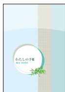
大腸がん 手帳 地域連携パス