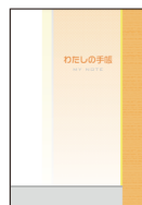
胃がん内視鏡治療後患者用手帳