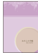
甲状腺がん 手帳 地域連携パス