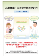
心筋梗塞・心不全手帳の使い方 ご本人・ご家族用