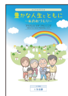
ACPの手引き 豊かな人生とともに