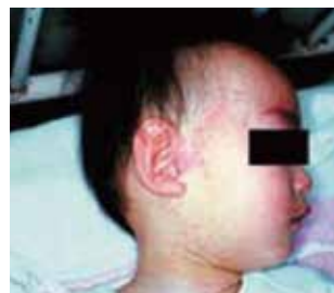
顔面にみられる発疹