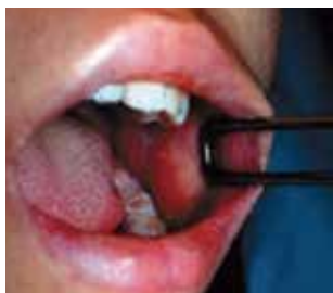
口腔内にみられるコプリック斑