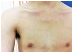
風疹による発疹（成人）