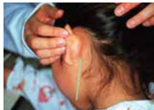
耳介後部リンパ節の腫脹が見られる